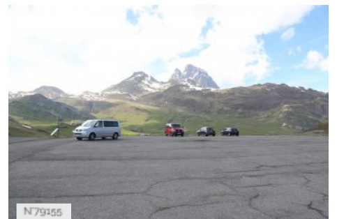
Parking au Col du Pourtalet à Laruns