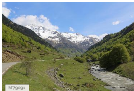
D934 Col Pourtalet - Laruns