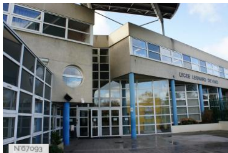
№07093 Ville de Saint-Witz - Lycée Léonard de Vinci/Fiche globale