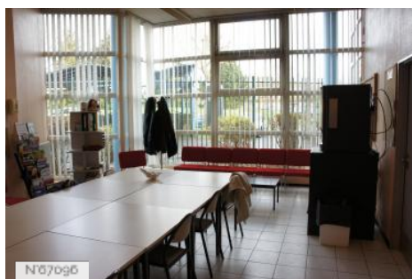
№07096 Ville de Saint-Witz - Lycée Léonard de Vinci/Salle des professeurs