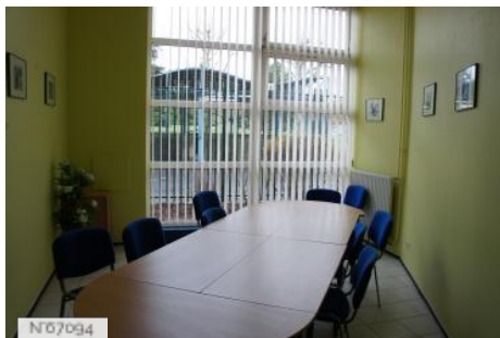
№07094 Ville de Saint-Witz - Lycée Léonard de Vinci/Bureau du proviseur