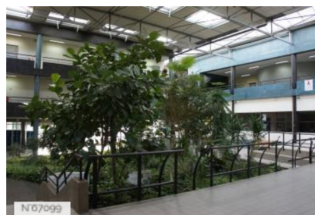
№07099 Ville de Saint-Witz - Lycée Léonard de Vinci/hall