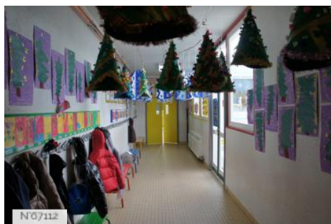
№07112 Ville de Saint-Witz - Ecole Jeanne du Chesne