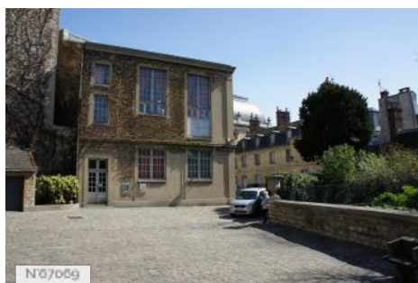
Mobilier national-Manufacture des Gobelins - Enclos