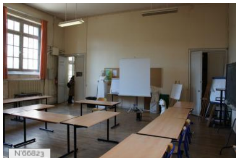
Mobilier national-Manufacture des Gobelins - Salles de dessin