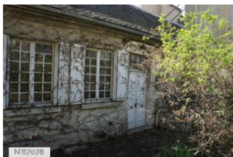
Mobilier national-Manufacture des Gobelins - Appartement du secrétaire général