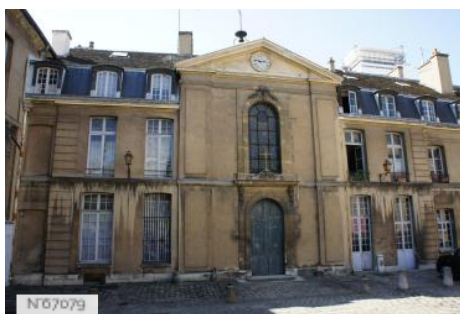
Mobilier national-Manufacture des Gobelins - Chapelle Saint-Louis des Gobelins