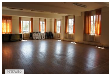
Mobilier national-Manufacture des Gobelins - Salle Lebrun