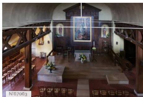
Ville de Noisy-le-Roi - Eglise rurale Saint-Lubin