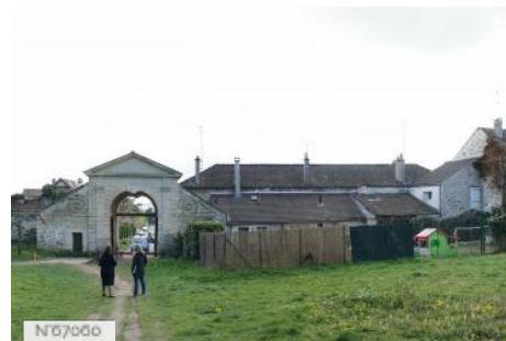
Ville de Noisy-le-Roi - Points de vue du village