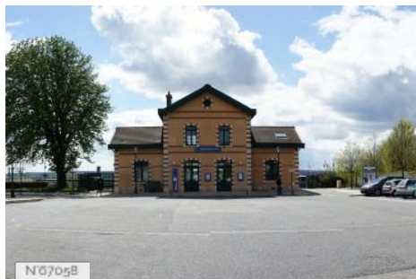
Ville de Noisy-le-Roi - Place de la gare