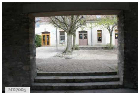
Ville de Noisy-le-Roi - Bibliothèque