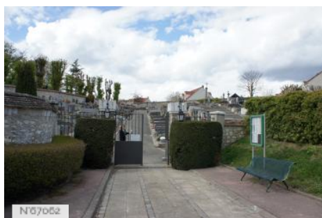
Ville de Noisy-le-Roi - Cimetière