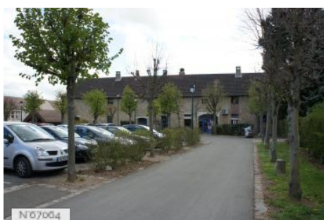
Ville de Noisy-le-Roi - Les écuries: salle polyvalente