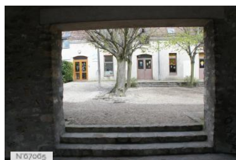
Ville de Noisy-le-Roi - Bibliothèque