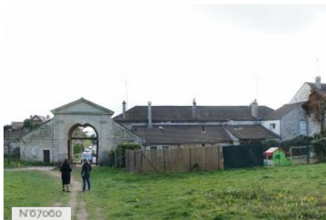
Ville de Noisy-le-Roi - Points de vue du village