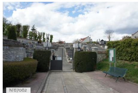
Ville de Noisy-le-Roi - Cimetière