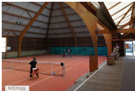
Ville de Noisy-le-Roi - Complexe sportif