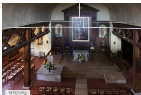
Ville de Noisy-le-Roi - Eglise rurale Saint-Lubin