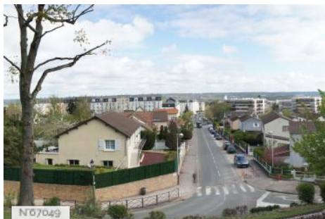
Ville de Fontenay-le-Fleury - Fiche globale