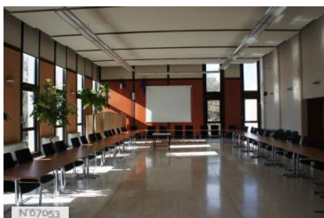
Ville de Fontenay-le-Fleury - Hôtel de Ville/Salle du conseil