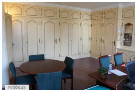
Ville de Fontenay-le-Fleury - Hôtel de Ville/Bureau du Maire