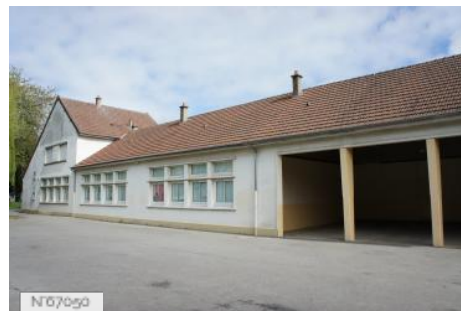
Ville de Fontenay-le-Fleury - Ecole Louis Pasteur