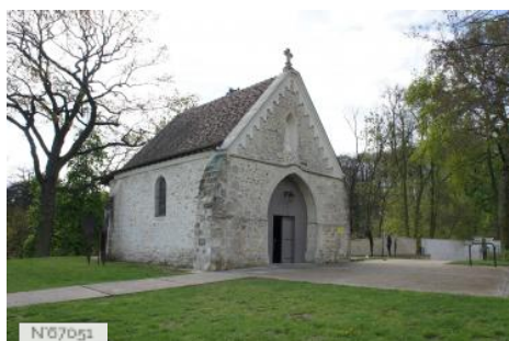
Ville de Fontenay-le-Fleury - Chapelle Saint-Jean