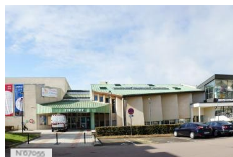
Ville de Fontenay-le-Fleury - Théâtre/Cinéma