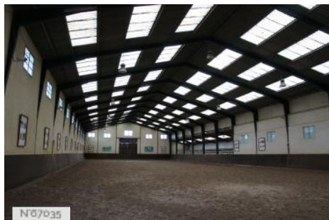
Haras national des Bréviaires - Fiche globale