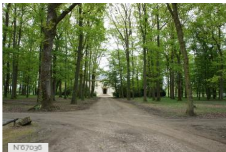
Haras national des Bréviaires - Maison de maître