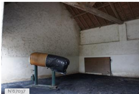
Haras national des Bréviaires - Atelier de reproduction