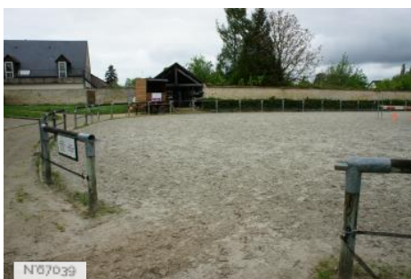
Haras national des Bréviaires - Carrière