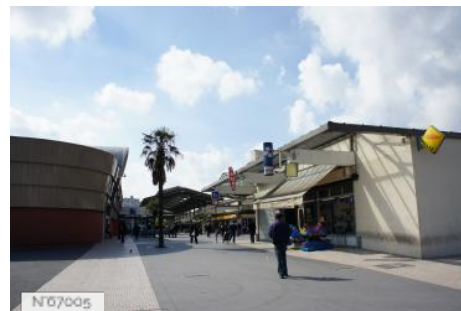
Ville de Meaux - Centre commercial La Verrière