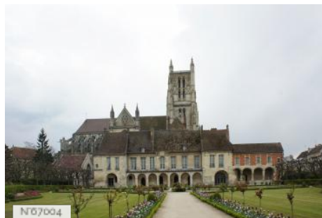
Ville de Meaux - Cité Episcopale et jardin Bossuet