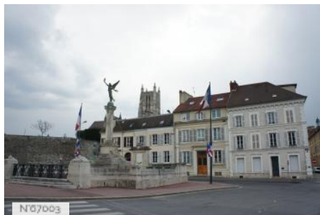
Ville de Meaux - Vues de la ville