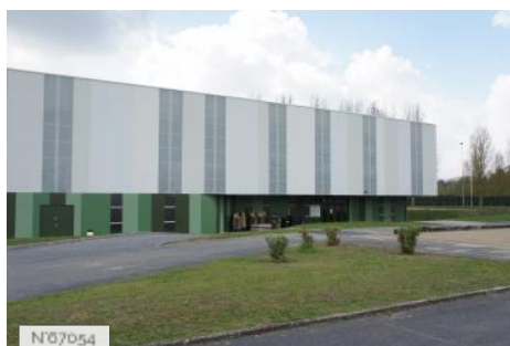
Ville de Meaux - Boulodrome