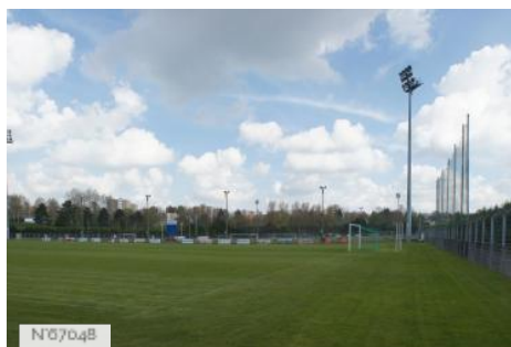
Ville de Meaux - Stade Corrazza