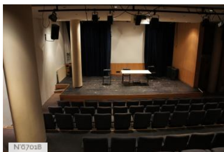
Ville de Meaux - Salle du Manège