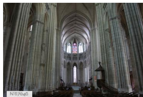
Ville de Meaux - Cathédrale Saint-Étienne