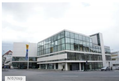
Ville de Meaux - Théâtre Luxembourg