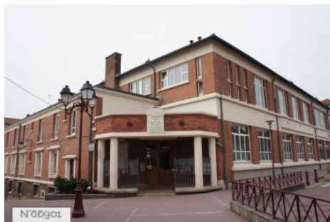
Ville de Sceaux - Ecole du Centre