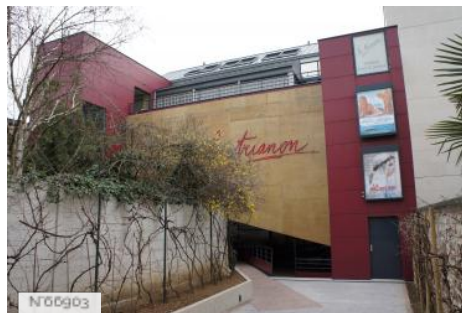
Ville de Sceaux - Cinéma Le Trianon