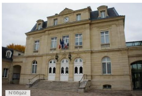
Ville de Sceaux - Hôtel de ville