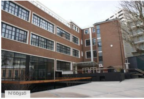
Lycée Jean Lurçat - Site Patay