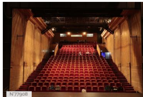
Ville d'Aubervilliers - Théâtre et Cinéma La Commune - Grande Salle