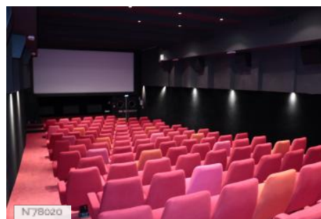
Ville d'Aubervilliers - Théâtre et Cinéma La Commune - La salle de projection