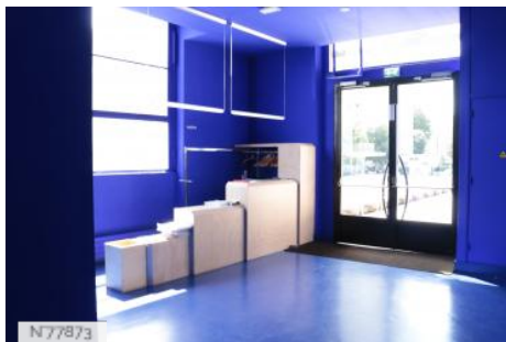
Ville d'Aubervilliers - Théâtre et Cinéma La Commune - Hall d'accueil