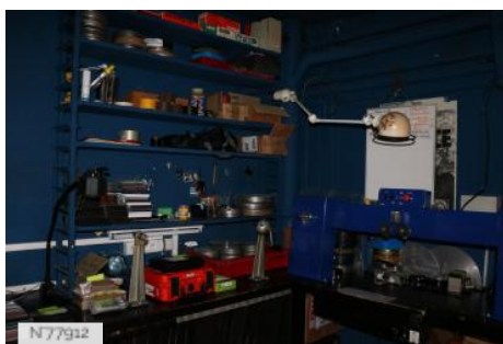
Ville d'Aubervilliers - Théâtre et Cinéma La Commune - Salle régie cinéma