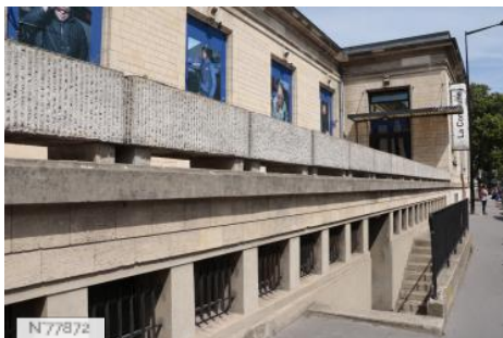
Ville d'Aubervilliers - Théâtre et Cinéma La Commune - Fiche globale