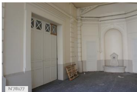
N 78177 Musée d'Ennery - Ecurie