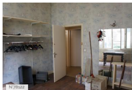
N 78102 Musée d'Ennery - Ancienne Loge