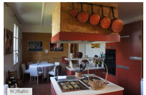
Château de Janvry - Ancienne cuisine - Aile Nord