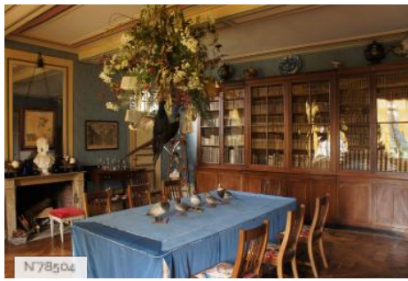
Château de Janvry - Salle à manger bibliothèque