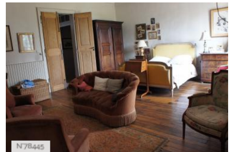
Château de Janvry - Chambre Aile Principale