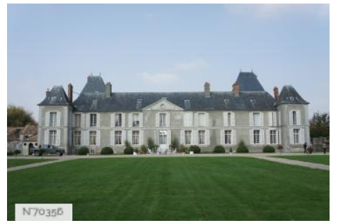
Château de Janvry - Fiche globale