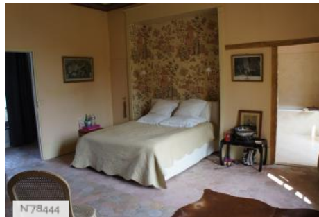
Château de Janvry - Chambre asiatique