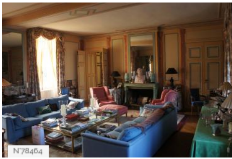
Château de Janvry - Salon