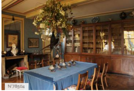
Château de Janvry - Salle à manger bibliothèque