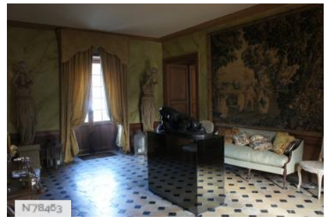
Château de Janvry - Vestibule