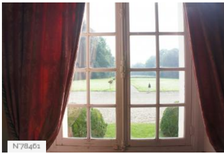
Château de Janvry - Petit Salon