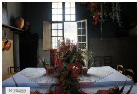
Château de Janvry - Ancienne cuisine - Aile Nord