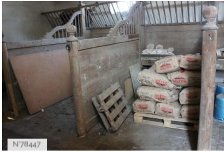
Château de Janvry - Anciennes écuries