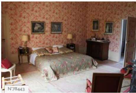
Château de Janvry - Chambre Jouy