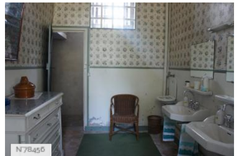
Château de Janvry - Salle de bains Aile Nord