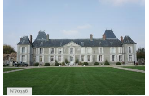
Château de Janvry - Fiche globale