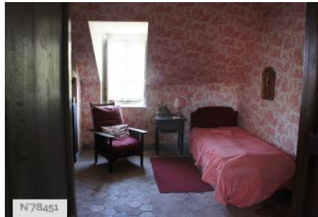
Château de Janvry - Chambres premier étage Aile Nord