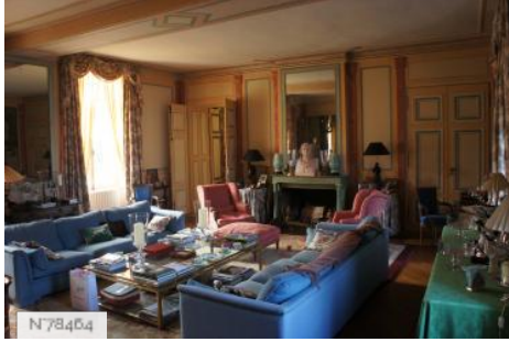
Château de Janvry - Salon