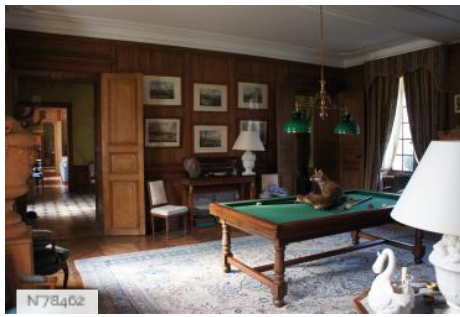
Château de Janvry - Billard