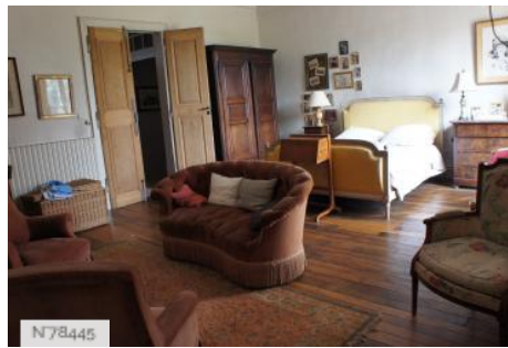
Château de Janvry - Chambre Aile Principale