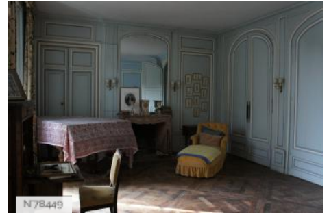
Château de Janvry - Chambre Bleue