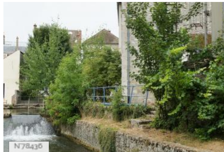
Ville de Nemours - Île du Perthuis