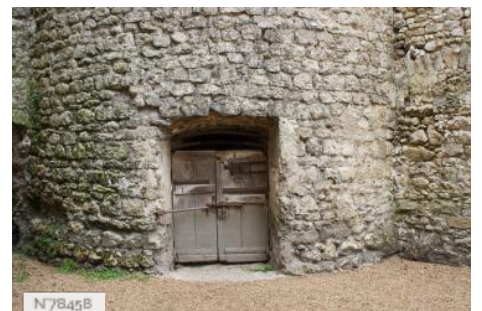
Ville de Nemours - Château Musée de Nemours - Cachots