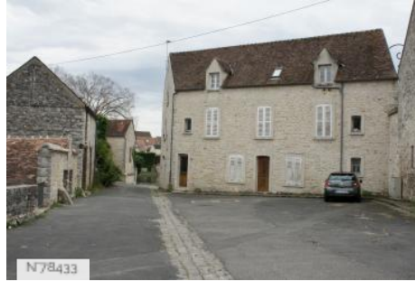
Ville de Nemours - Château Musée de Nemours - Basse Cour