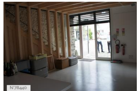
Ville de Nemours - Château Musée de Nemours - Conciergerie & Salle polyvalente