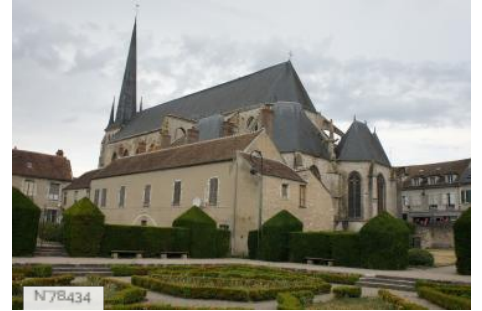
Ville de Nemours - Exterieurs