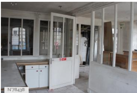
Ville de Nemours - Moulin de Nemours