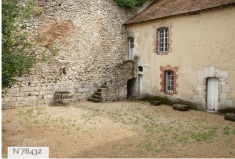
Ville de Nemours - Château Musée de Nemours - Cour de la Pistol