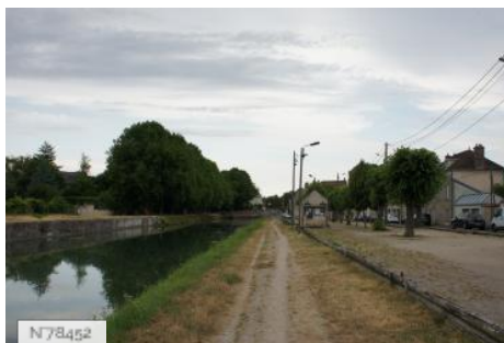
Ville de Nemours - Fiche globale