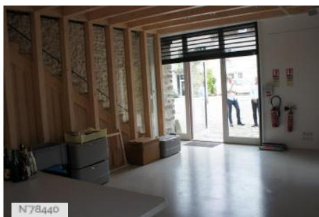
Ville de Nemours - Château Musée de Nemours - Conciergerie & Salle polyvalente