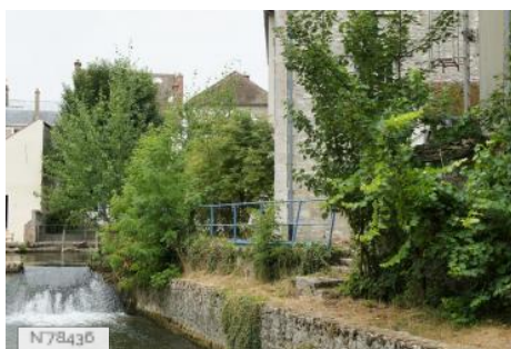
Ville de Nemours - Île du Perthuis