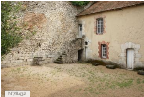
Ville de Nemours - Château Musée de Nemours - Cour de la Pistol