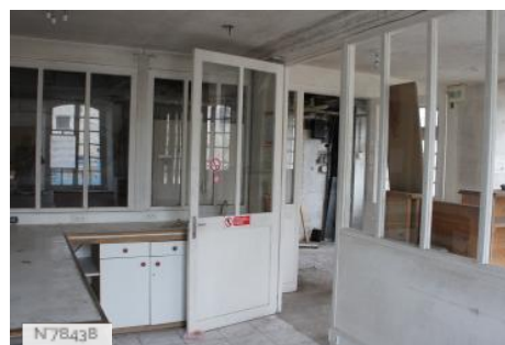
Ville de Nemours - Moulin de Nemours