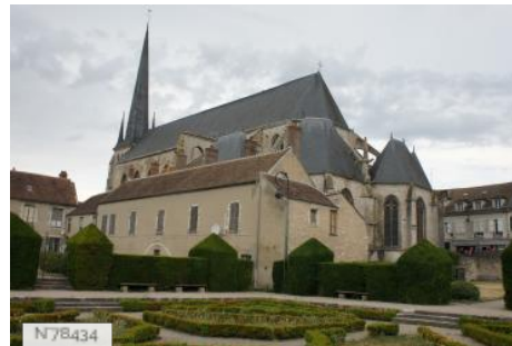
Ville de Nemours - Exterieurs