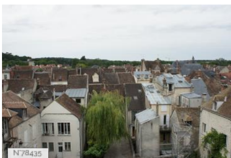
Ville de Nemours - Château Musée de Nemours - Fiche globale