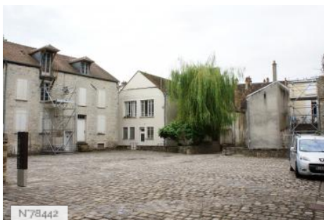
Ville de Nemours - Château Musée de Nemours - Cour d'Honneur