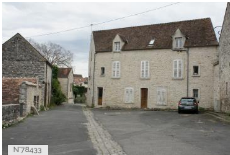
Ville de Nemours - Château Musée de Nemours - Basse Cour