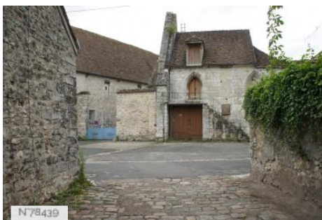
Ville de Nemours - Château Musée de Nemours - Lavoir et Douves