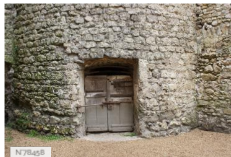
Ville de Nemours - Château Musée de Nemours - Cachots