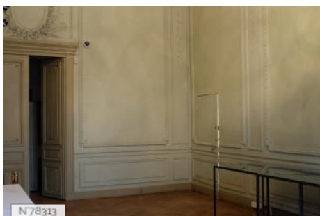
Hôtel de Galliffet - Salle de réunion