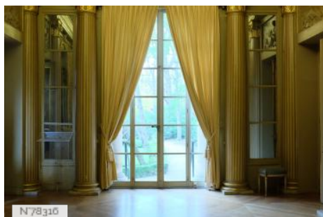
Hôtel de Galliffet - Salon ovale