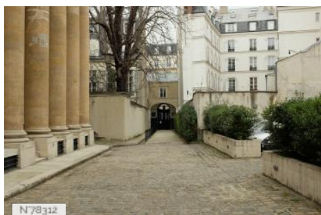
Hôtel de Galliffet - Cour intérieure