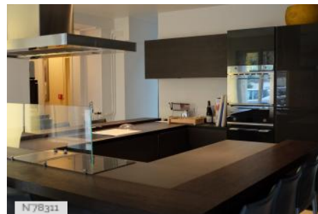
Hôtel de Galliffet - Cuisine