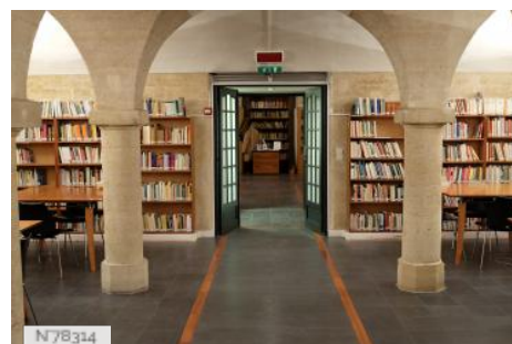
Hôtel de Galliffet - Bibliothèque