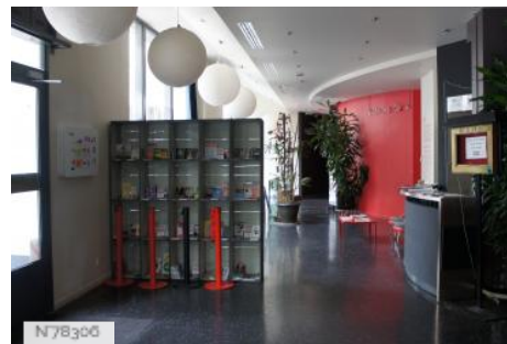
Les Trois Baudets - Hall d'entrée