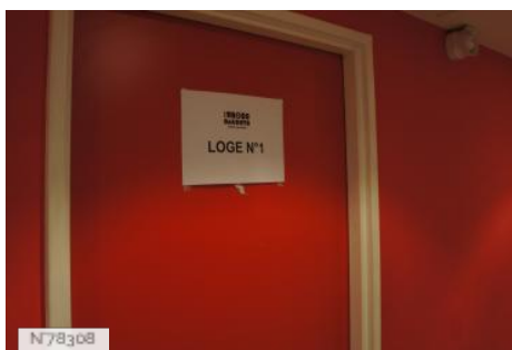
Les Trois Baudets - Loges