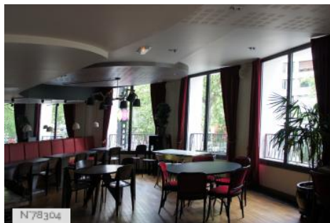
Les Trois Baudets - Restaurant