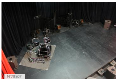
Les Trois Baudets - Salle de concert