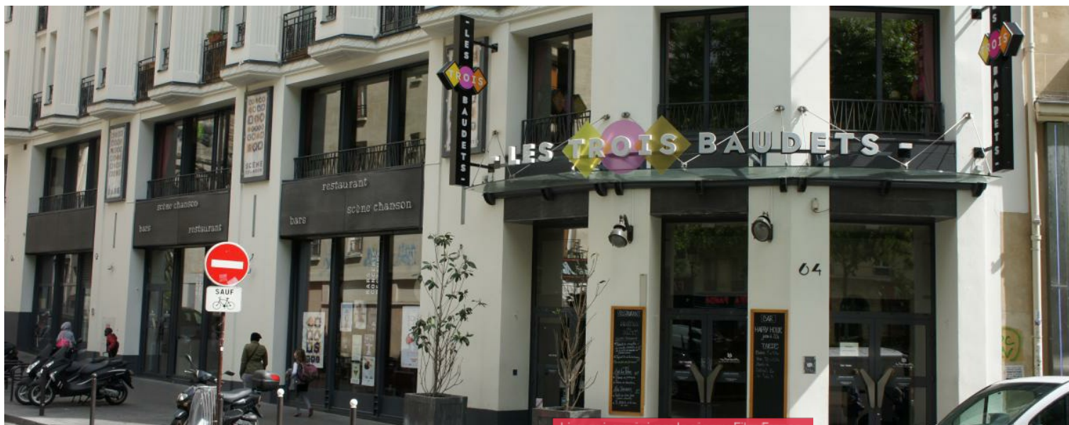
Lieu pré-rapéré par le réseau Film France