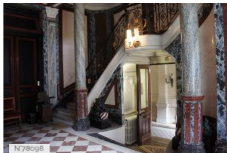
Musée d'Ennery - Hall d'entrée