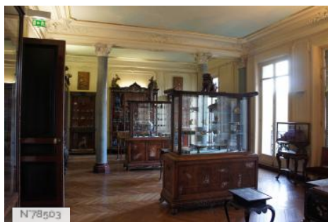
Musée d'Ennery - Fiche globale