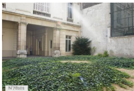
Musée d'Ennery - Cour intérieure