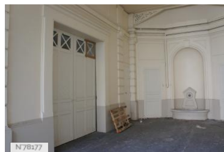
Musée d'Ennery - Ecurie