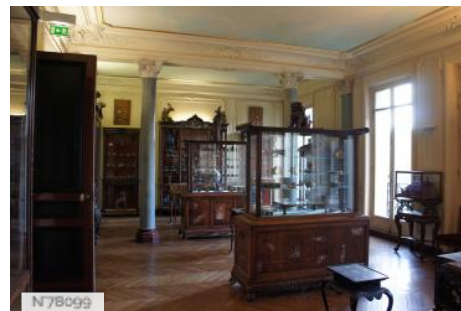
Musée d'Ennery - Salles d'exposition