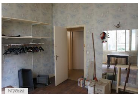
Musée d'Ennery - Ancienne Loge