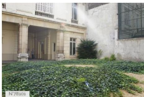
Musée d'Ennery - Cour intérieure