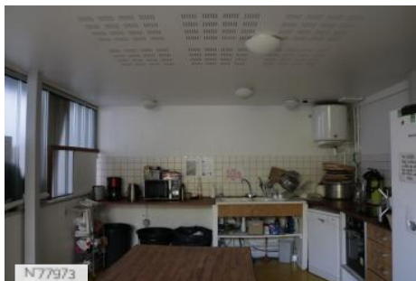
Ville d'Aubervilliers - Les Laboratoires - Cuisine