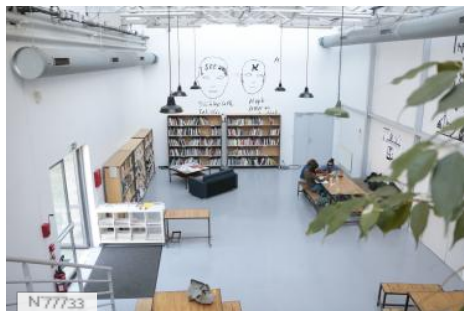
Ville d'Aubervilliers - Les Laboratoires - Fiche globale