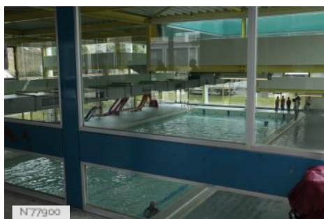
Ville d'Aubervilliers - Piscine - Petit bassin