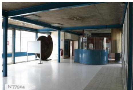
Ville d'Aubervilliers - Piscine - Fiche globale