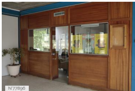
Ville d'Aubervilliers - Piscine - Ancien Hall