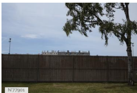
Ville d'Aubervilliers - Piscine - Solarium