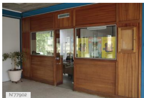
Ville d'Aubervilliers - Piscine - Bureau