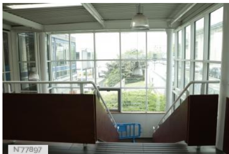
Ville d'Aubervilliers - Piscine - Accueil