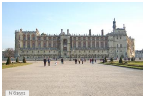
Château et Domaine de Saint-Germain-en-Laye - Fiche globale