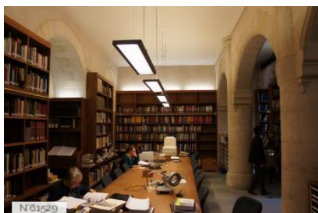
Château et Domaine de Saint-Germain-en-Laye - Bibliothèque