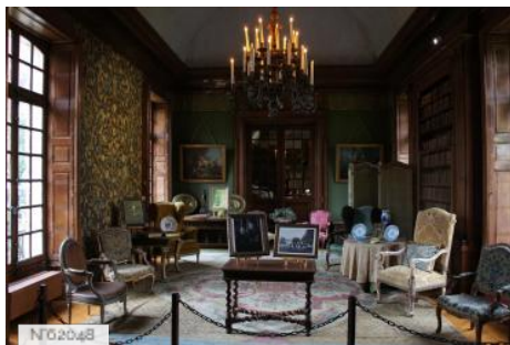
Parc et château de Courances - Galerie des Singes