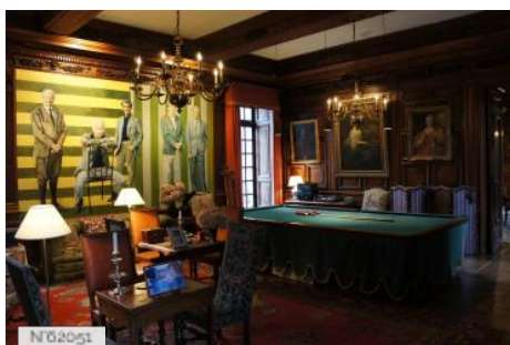
Parc et château de Courances - Salon de billard