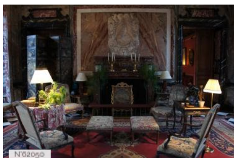
Parc et château de Courances - Salon de marbre