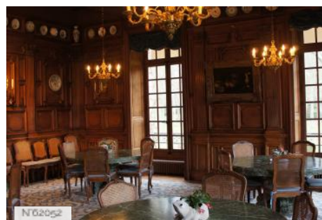
Parc et château de Courances - Salle à manger