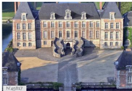
Parc et château de Courances - Extérieurs