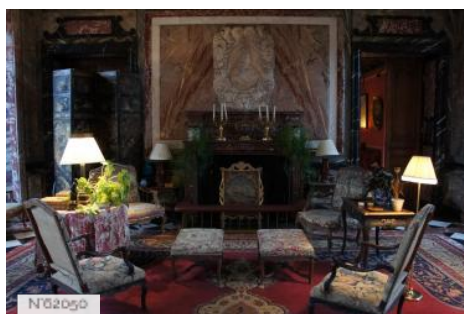
Parc et château de Courances - Salon de marbre