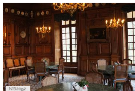
Parc et château de Courances - Salle à manger