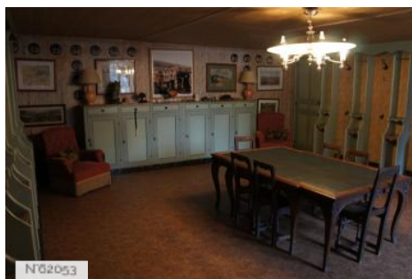
Parc et château de Courances - Salle de retour chasse