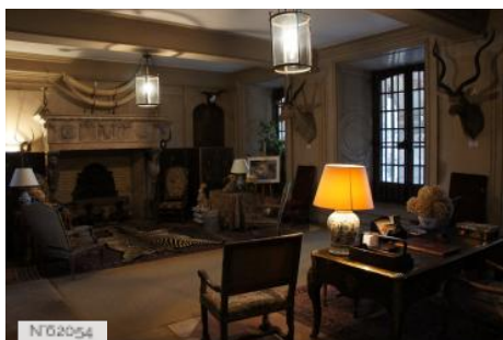
Parc et château de Courances - Salle des trophées