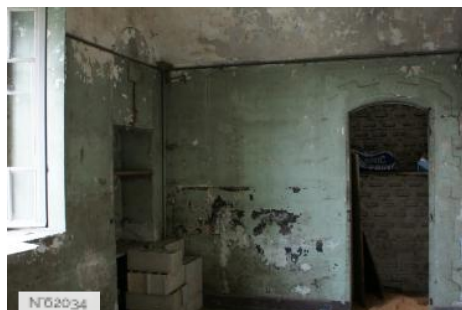
Fort Militaire du Trou d'Enfer - Casernement troupes