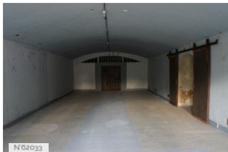
Fort Militaire du Trou d'Enfer - Casernement officiers