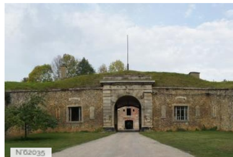
Fort Militaire du Trou d'Enfer - Extérieurs