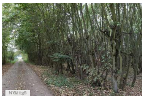
Fort Militaire du Trou d'Enfer - Alentours du fort