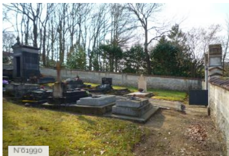
Village d'Epiais-Rhus - Cimetière de Rhus