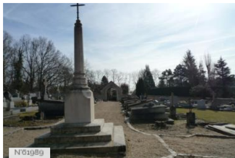
Village d'Epiais-Rhus - Fiche globale