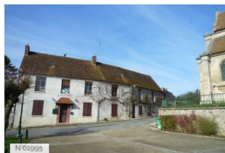
Village d'Epiais-Rhus - Place de l'Eglise