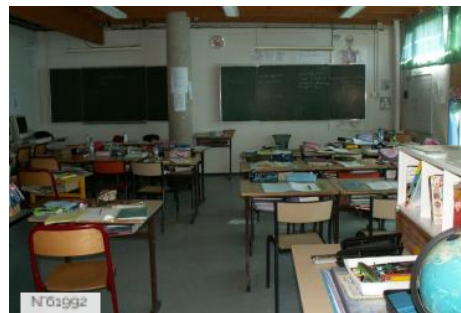
Village d'Epiais-Rhus - Ecole