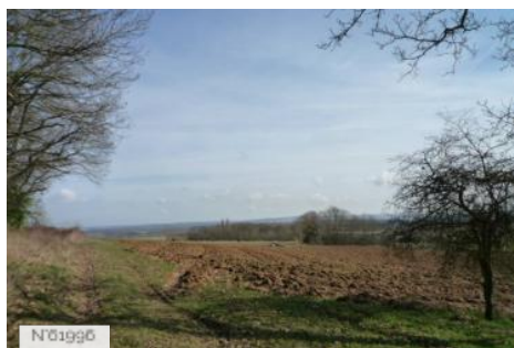
Village d'Epiais-Rhus - Vues du village