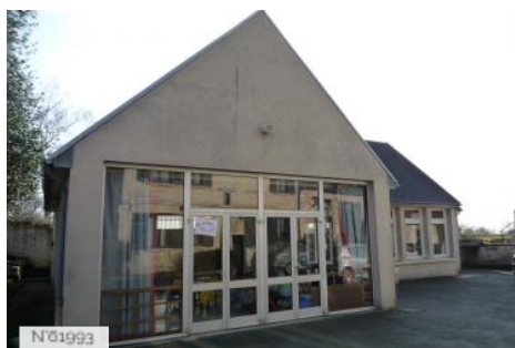
Village d'Epiais-Rhus - Foyer rural