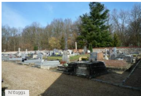
Village d'Epiais-Rhus - Cimetière d'Epiais