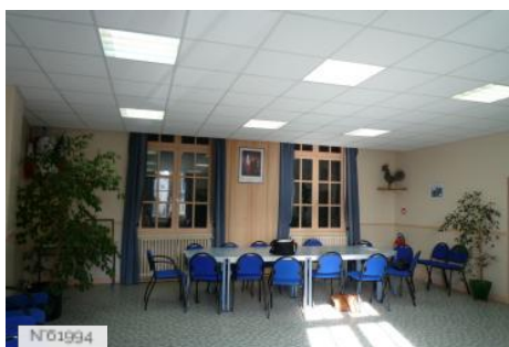
Village d'Epiais-Rhus - Mairie