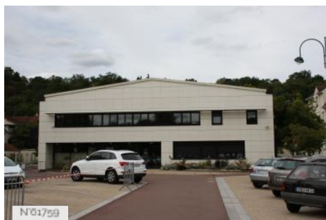
Ville de Jouy-en-Josas - Salle du vieux marché