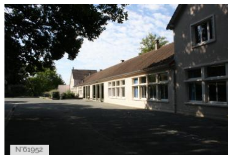
Ville de Jouy-en-Josas - Ecole primaire Bourget-Calmette