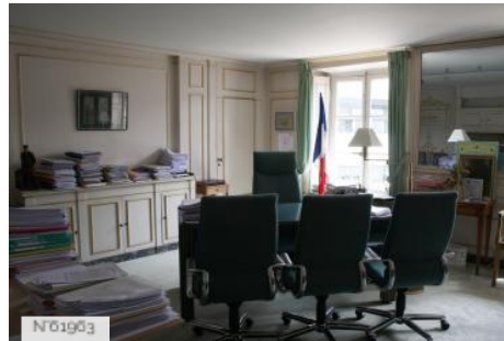
Ville de Jouy-en-Josas - Hôtel de ville/Bureau du Maire