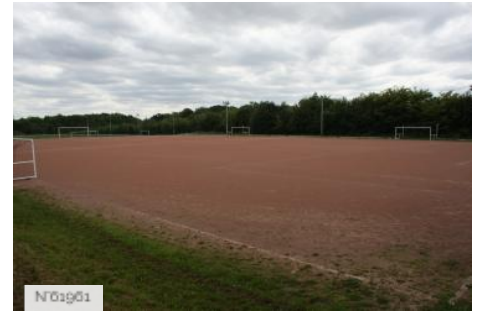
Ville de Jouy-en-Josas - Domaine de la Cour Roland/Terrains découverts