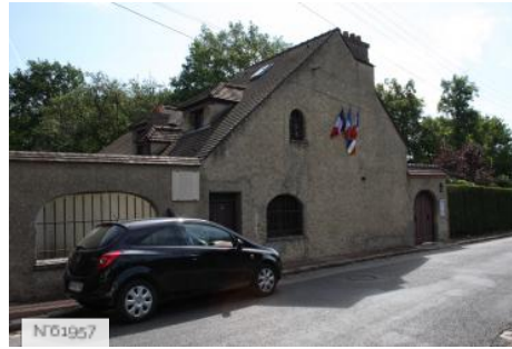
Ville de Jouy-en-Josas - Maison de Jeanne et Léon Blum