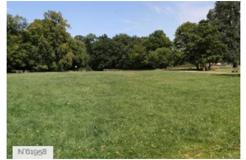
Ville de Jouy-en-Josas - Domaine de la Cour Roland/Extérieurs