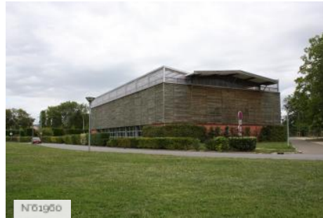
Ville de Jouy-en-Josas - Domaine de la Cour Roland/Terrains de tennis couverts