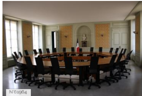
Ville de Jouy-en-Josas - Hôtel de ville/Salle du conseil