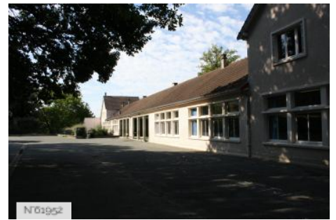
N°01952 Ville de Jouy-en-Josas - Ecole primaire Bourget-Calmette