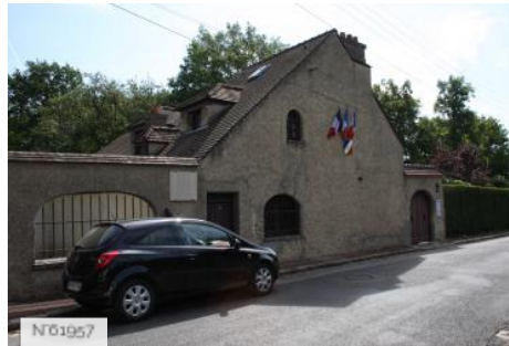
N°01957 Ville de Jouy-en-Josas - Maison de Jeanne et Léon Blum