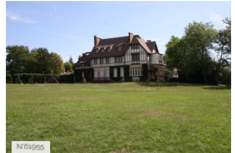
Ville de Jouy-en-Josas - Ecole Jeanne Blum