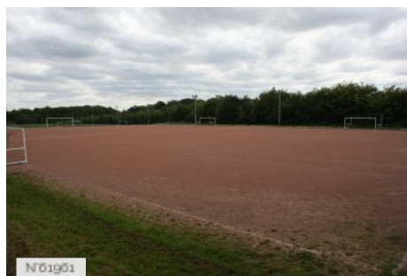
Ville de Jouy-en-Josas - Domaine de la Cour Roland/Terrains découverts