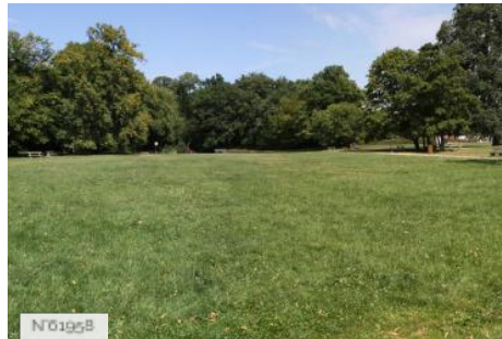
Ville de Jouy-en-Josas - Domaine de la Cour Roland/Extérieurs