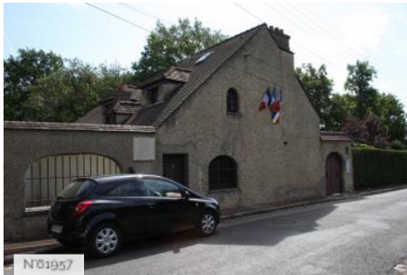
Ville de Jouy-en-Josas - Maison de Jeanne et Léon Blum