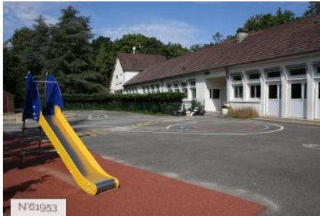
Ville de Jouy-en-Josas - Ecole maternelle Bourget-Calmette