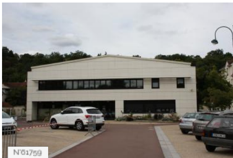
Ville de Jouy-en-Josas - Salle du vieux marché