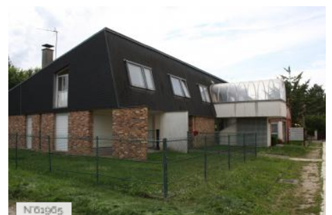
Ville de Jouy-en-Josas - Espace cyberbase-Bibliothèque