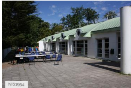
Ville de Jouy-en-Josas - Centre de loisirs