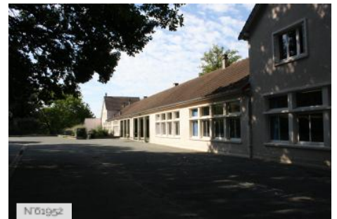
№01952 Ville de Jouy-en-Josas - Ecole primaire Bourget-Calmette