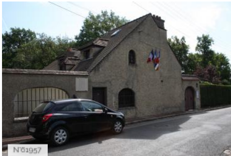
№01957 Ville de Jouy-en-Josas - Maison de Jeanne et Léon Blum