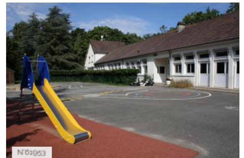
Ville de Jouy-en-Josas - Ecole maternelle Bourget-Calmette