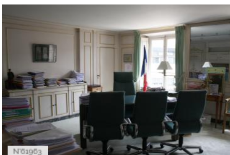
Ville de Jouy-en-Josas - Hôtel de ville/Bureau du Maire