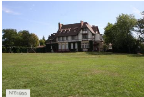
Ville de Jouy-en-Josas - Ecole Jeanne Blum