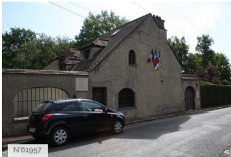
№01957 Ville de Jouy-en-Josas - Maison de Jeanne et Léon Blum