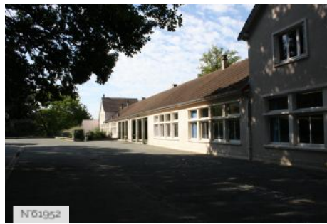
№01952 Ville de Jouy-en-Josas - Ecole primaire Bourget-Calmette