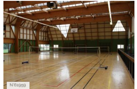
№01959 Ville de Jouy-en-Josas - Domaine de la Cour Roland/Gymnase