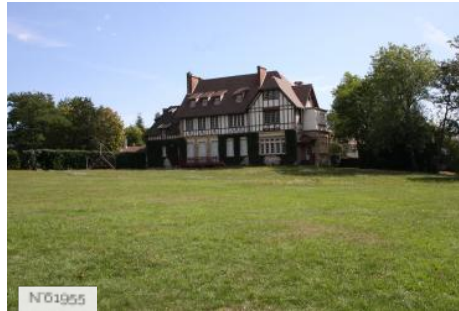
№01955 Ville de Jouy-en-Josas - Ecole Jeanne Blum