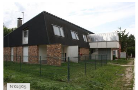
№01965 Ville de Jouy-en-Josas - Espace cyberbase-Bibliothèque