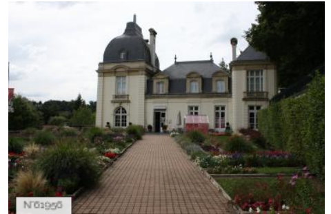
№01956 Ville de Jouy-en-Josas - Musée de la toile de Jouy