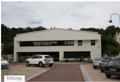
№01959 Ville de Jouy-en-Josas - Salle du vieux marché