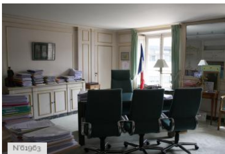
№01963 Ville de Jouy-en-Josas - Hôtel de ville/Bureau du Maire