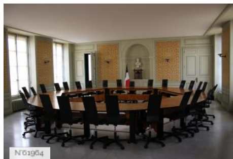
№01964 Ville de Jouy-en-Josas - Hôtel de ville/Salle du conseil