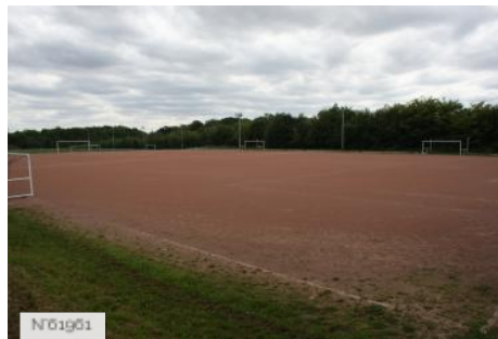
№01961 Ville de Jouy-en-Josas - Domaine de la Cour Roland/Terrains découverts