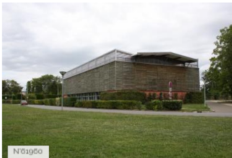
№01960 Ville de Jouy-en-Josas - Domaine de la Cour Roland/Terrains de tennis couverts