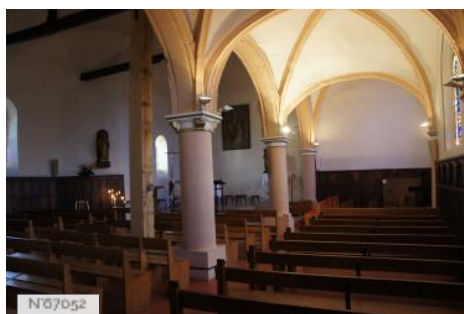
Ville de Fontenay-le-Fleury - Eglise Saint-Germain