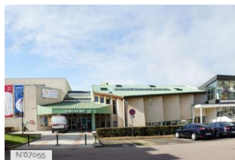
Ville de Fontenay-le-Fleury - Théâtre/Cinéma