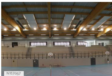
Ville de Fontenay-le-Fleury - Gymnase du Levant