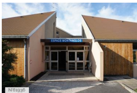
Village de Santeny - Espace Montanglos