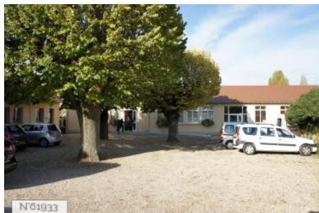
Village de Santeny - Salle des mariages et du conseil