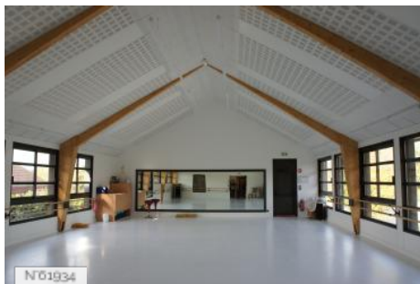
Village de Santeny - Salle de danse