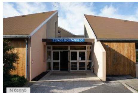
Village de Santeny - Espace Montanglos