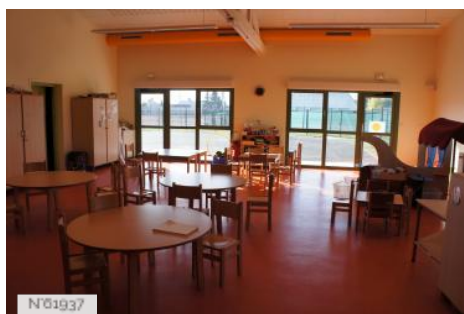
Village de Santeny - Centre de loisirs des 4 saules