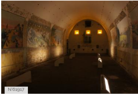
N°01917 Fort de Cormeilles - Poudrière