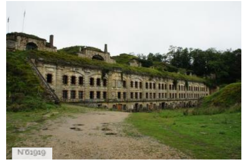
N°01919 Fort de Cormeilles - Fort