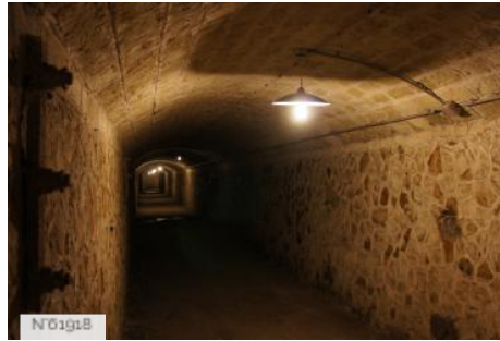
N°01918 Fort de Cormeilles - Caponnière