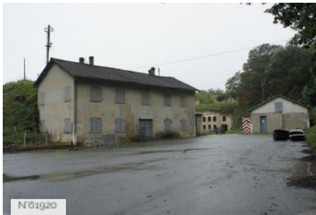
N°01920 Fort de Cormeilles - Extérieurs