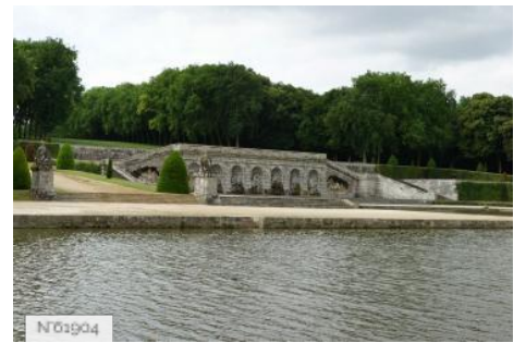
Château de Vaux-le-Vicomte - Grottes et terrasse