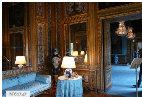
Château de Vaux-le-Vicomte - Cabinet des jeux