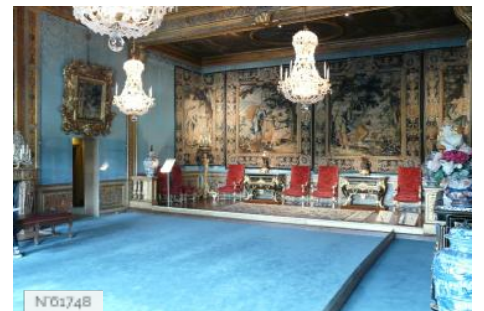
Château de Vaux-le-Vicomte - Chambre des Muses