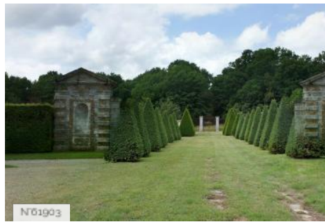
Château de Vaux-le-Vicomte - Potager