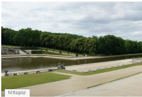
Château de Vaux-le-Vicomte - Canal et poele