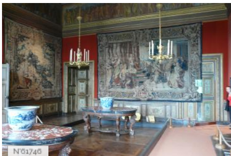
Château de Vaux-le-Vicomte - Grande chambre carrée