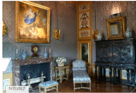
Château de Vaux-le-Vicomte - Cabinet de Madame Fouquet