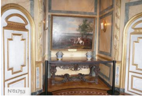
Château de Vaux-le-Vicomte - Cabinet des bains