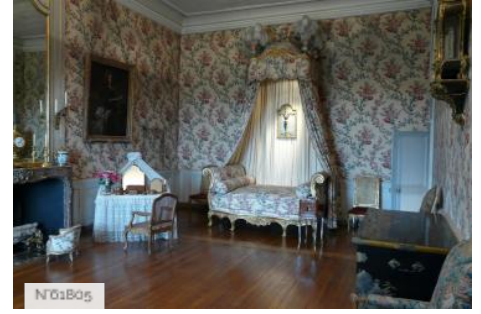
Château de Vaux-le-Vicomte - Chambre Louis XV