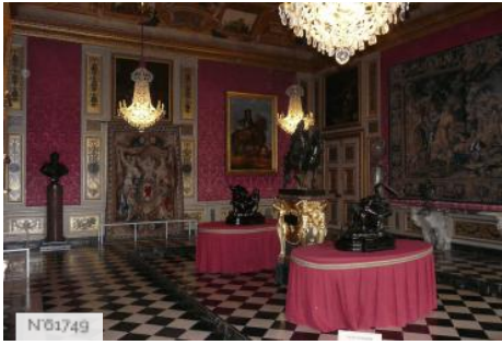
Château de Vaux-le-Vicomte - Salon d'Hercule