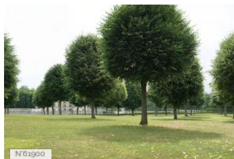
Château de Vaux-le-Vicomte - Bosquet Alexandre