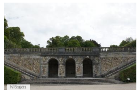
Château de Vaux-le-Vicomte - Confessional ou grotte sèche