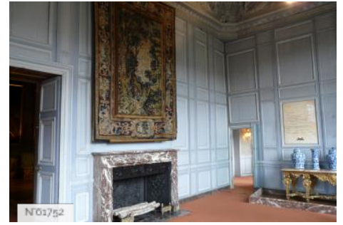
Château de Vaux-le-Vicomte - Cabinet du Roi