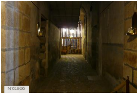
Château de Vaux-le-Vicomte - Cuisines