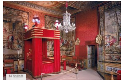
Château de Vaux-le-Vicomte - Chambre à coucher de Fouquet