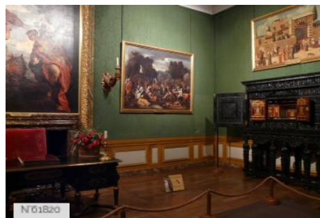
Château de Vaux-le-Vicomte - Antichambre