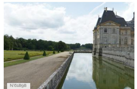
Château de Vaux-le-Vicomte - Jardins à la Française