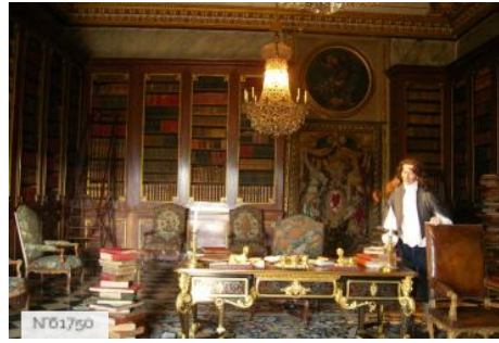
Château de Vaux-le-Vicomte - Bibliothèque