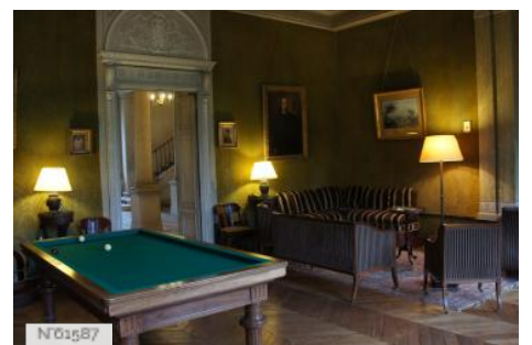
Château de Vaugien - Grand salon