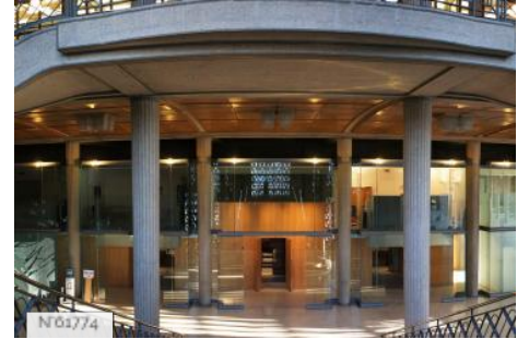
Conseil économique social et environnemental - Escalier Monumental