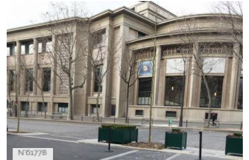
Conseil économique social et environnemental - Extérieurs