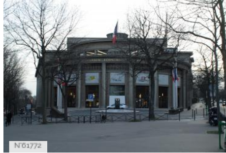
Conseil économique social et environnemental - Fiche Globale